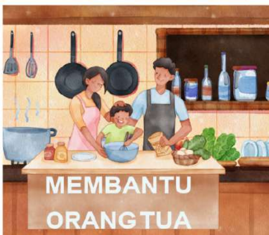
MEMBANTU ORANG TUA